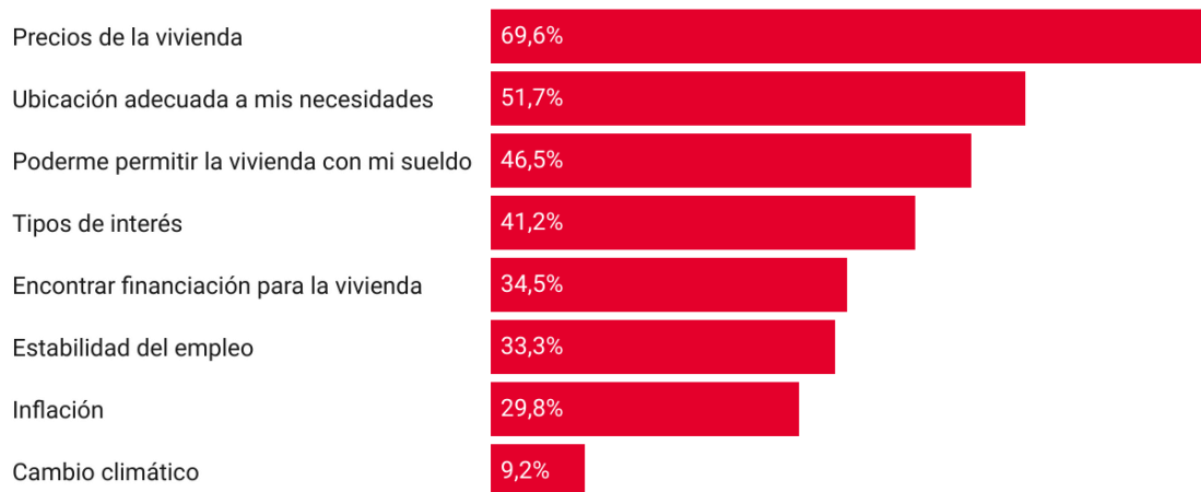
Ilustración 1. Aspectos que preocupan en la compra de vivienda